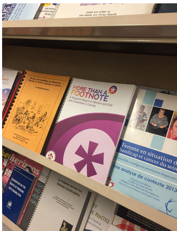
Rapport «Plus qu'une note de bas de page»

Au Canada, les femmes et les filles en situation de handicap font face à des défis et des obstacles uniques qui nécessitent des approches sexospécifiques et intersectionnelles afin d'éclairer la recherche, l'éducation, les politiques et les pratiques.