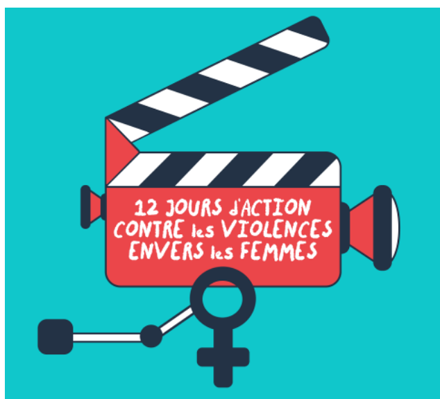
Illustration pour la campagne des 12 jours sur la violence envers les femmes

Voilà six ans que Hanane Khales, coordonnatrice des communications, représente